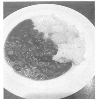
特製カレーライス600円

3階のお座敷や2階のテーブル席で宴会もできますが、1階はテーブル席だけでなくカウンター席もあって、1人でも、友達や家族とでも楽しめます。甲子園球場に野球を見に来たり近くに來たりした時には是非「千穂」のお料理に癒されに行ってみて下さい。