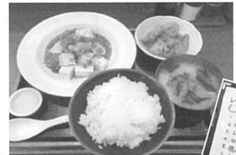
ランチメニュー。ごはんおかわり無料!