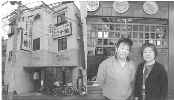
千穂の外観と、おとうさんとおかあさん