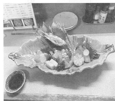
造り盛り合わせ 880円