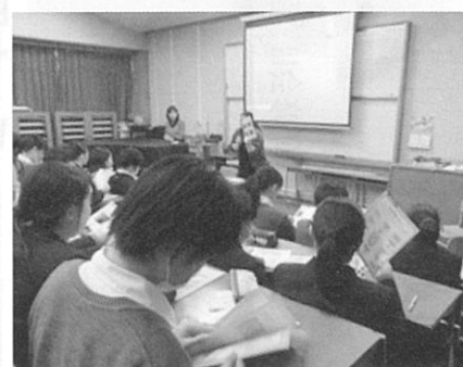
熱心に説明を聞く高校生