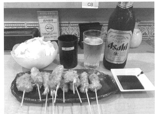
串カツ（お得なおまかせセット）