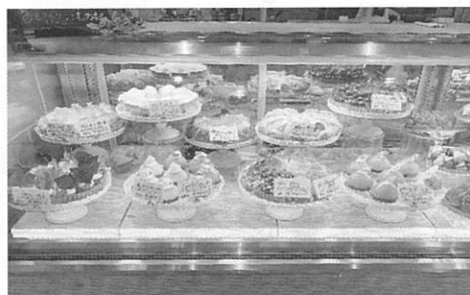
メニューの紹介(一部)