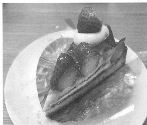
こだわりいちごタルト