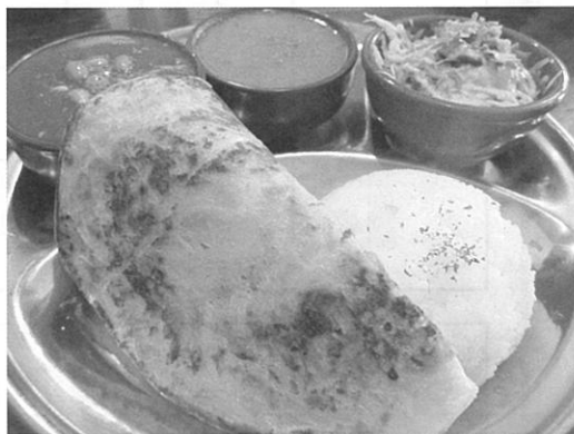
まはらじゃセット