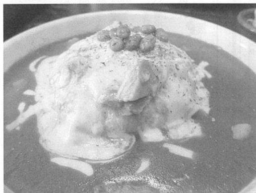
オム&チーズカレー