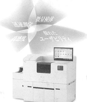
全自動免疫測定装置 HISCL-5000 医療機器製造業品製造販売承認番号:22500AMX01930000