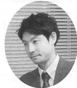
学術奨励賞 大沼会員