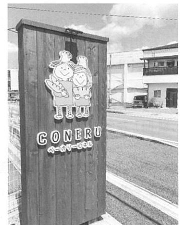
可愛いイラストの看板

そして看板メニューはもう一つ、今大人気の生食パン“プレミアム食パン”。週末限定で販売されているらしく、こちらも即完売もの。私もまだ食べたことがないのでぜひとも近日中にゲットしたいと狙っています！そして最後に撮影させて頂いた驚きの“1升パン”。1升餅とはよく聞きますが、1升パンは皆さん耳にしたことがあったでしょうか。1升の生地をまとめて焼いたパンは1週間前に要予約で、お誕生日のお祝いや特別な行事に贈られるそうです。こちらの写真は半升パンですが遠方に住んでいる方へのエールを込めた“頑張れ！”。なんだかほっこりする素敵なお店です。店内のパンは